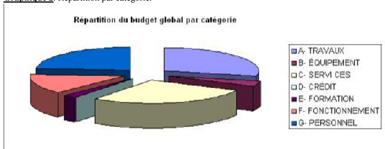
Graphique 2. Répartition par catégorie.

L'analyse par catégorie du budget global relève que 80% du budget sont répartis entre les "travaux", "services" et "personnel" qui représentent respectivement 28, 28 et 24%.